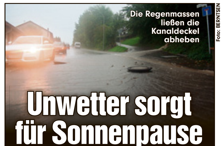
Die Regenmassen ließen die Kanaldeckel abheben

Am Samstag reizte die laue Sommernacht gar manchen zum Singen, Tanzen und Gitarre spielen. Einfach herrlich!